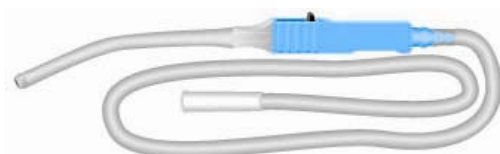
Réf : 546725